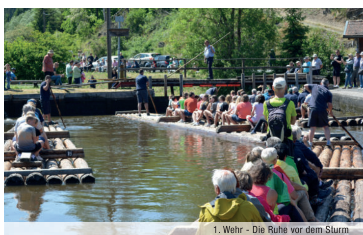
1. Wehr - Die Ruhe vor dem Sturm